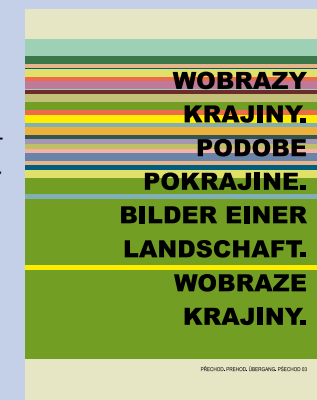
titul - Titelmotiv Karl Vouk

Die Wanderausstellung widmet sich mit moderner Kunst dem landschaftlichen und kulturellen Wandel und verbindet als internationales Projekt Deutschland, Österreich und Slowenien. Angesprochene Themen sind Heimat, Lebens- und Grenzräume, Tagebau und Nationalität. Das Begleitprogramm umfasst Bereiche der visuellen Kunst, Literatur und Musik.