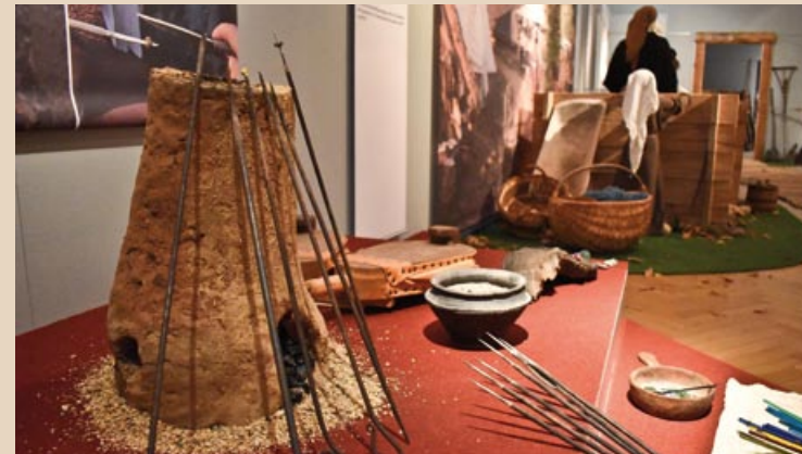
Hlinowe kachle k zhotowjenju škleńčanych parličkow Lehmofen zur Herstellung von Glasperlen

Wer waren die Lusizer und Milzener, die vor mehr als 1000 Jahren entlang der Spree siedelten? Burgwälle, Hügelgräber und unzäh- lige Orts- und Familiennamen zeugen von den slawischen Wurzeln östlich von Saale und Elbe. Die Ausstellung begibt sich auf die Spuren des slawischen Mittelalters in der Lausitz und basiert auf wissenschaftlichen Forschungen und Erkenntnissen der Archäotechnik