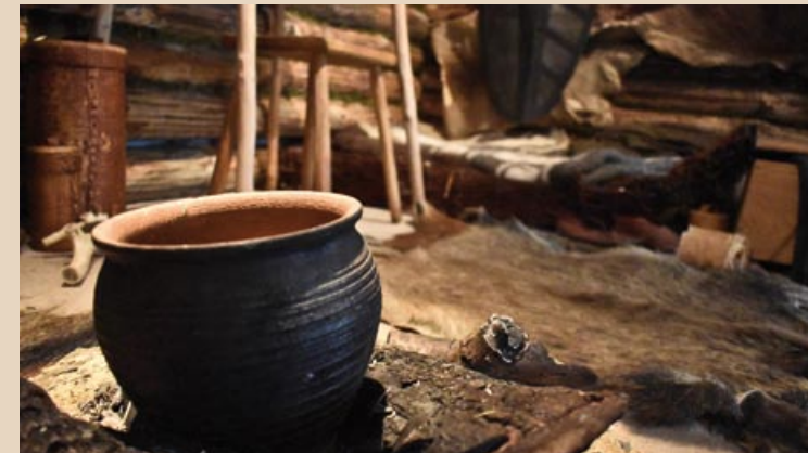
Rekonstrukcija srjedžowěkowskeho kładžiteho domu Nachbau eines mittelalterlichen Blockhauses

Přizjewjenje Voranmeldung Tel. 03591.2708700, sekretariat@sorbisches-museum.de