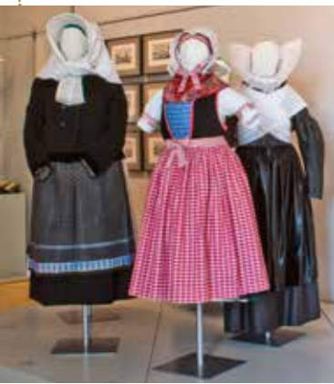
Serbske ewangelske narodne drasty / Sorbische evangelische Trachten Foto: J.Bart, Serbski muzej / Sorbisches Museum, 2017