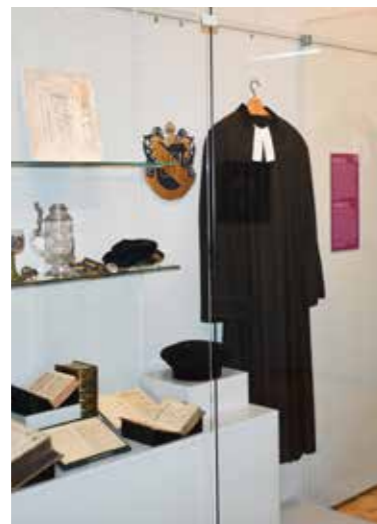
Wid do wosebiteje wustajeńcy / Blick in die Sonderausstellung

Gottes Wort in der Muttersprache – diese Forderung Martin Luthers war Ausgangspunkt für das Entstehen des sorbischen Schrifttums und für die weitere geistig-kulturelle Entwicklung der Sorben. Die Ausstellung im Rahmen des Förderprojektes „Gesichter der Reformation in der Oberlausitz, Böhmen und Schlesien“ des Kulturraumes Oberlausitz / Niederschlesien zeigt, welchen Einfluss die Reformation auf die autochthone slawische Minderheit in Deutschland hatte.